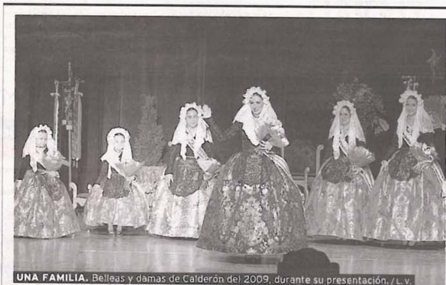
UNA FAMILIA. Belleas y damas de Calderón del 2009, durante su presentación.